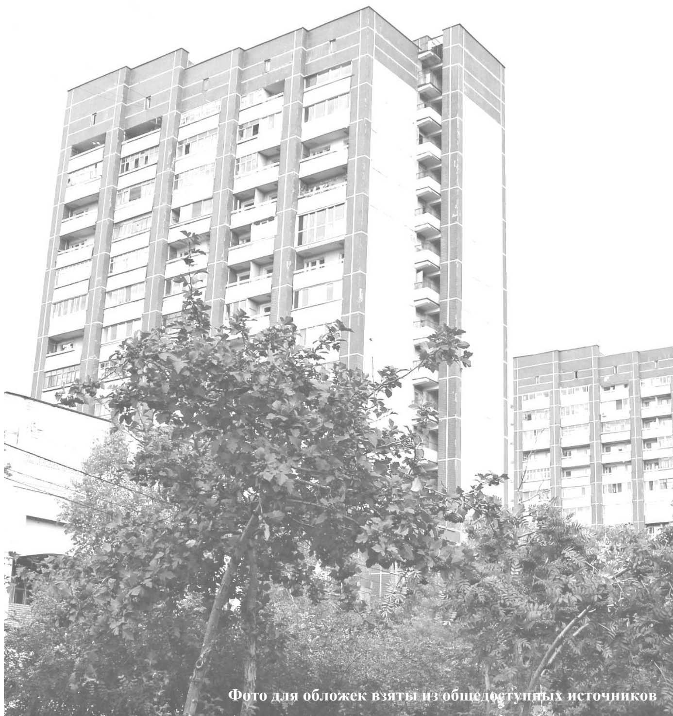
Фото для обложек взяты из общедоступных источников